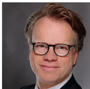
Carl-Jan von der Goltz Maturus Finance GmbH